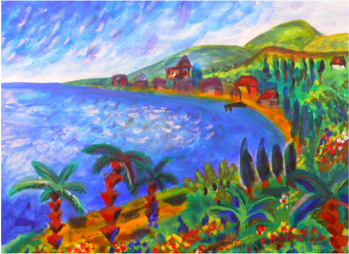
Jule- 18 Jahre Südliche Landschaftg Kunstschule - Farbton - Freie Waldorfschule Dresden - Deutschland