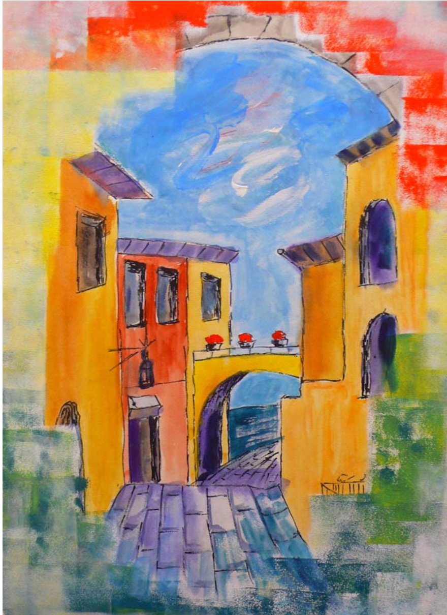
Johannes - 18 Jahre Haus in der Toscana Kunstschule - Farbton - Freie Waldorfschule Dresden - Deutschland