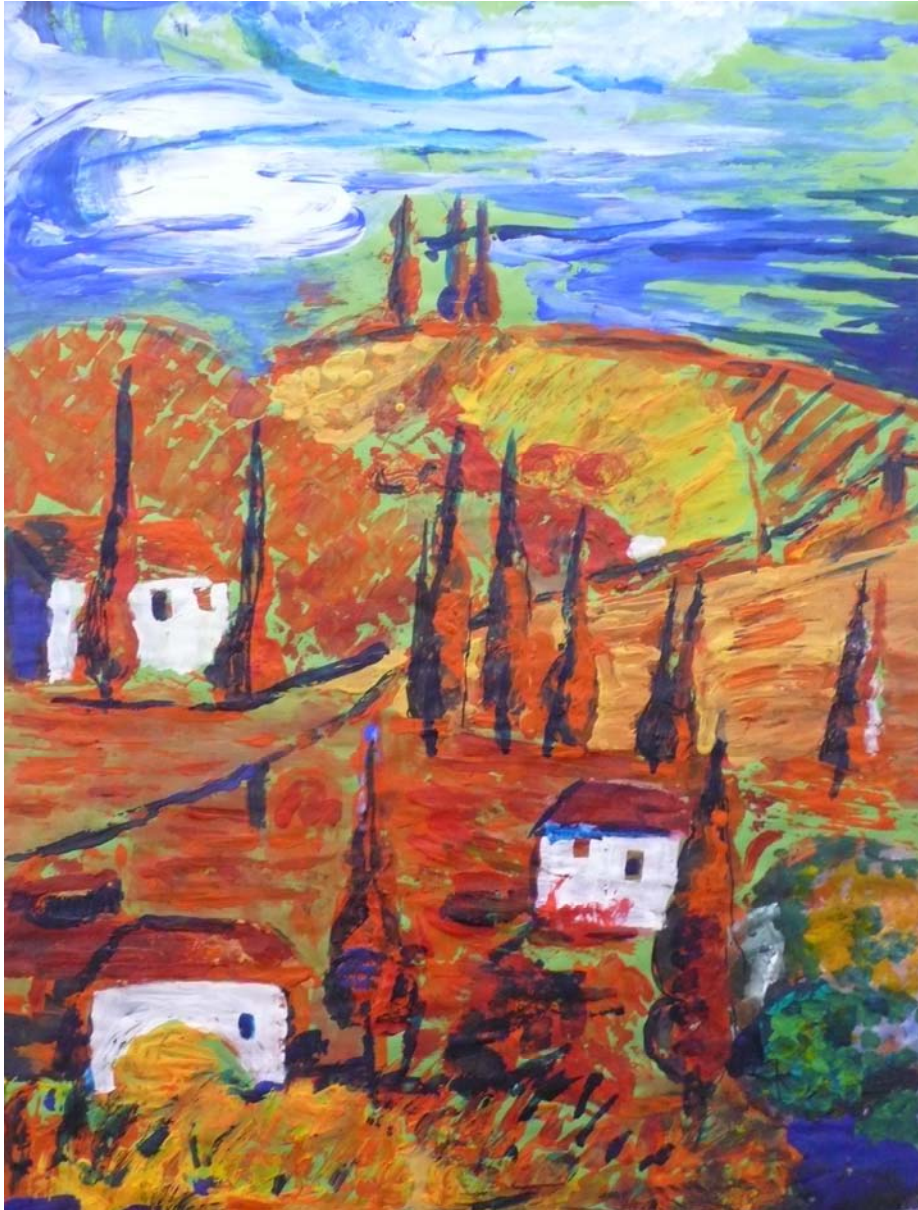
Sigrun - 18 Jahre Toscana Kunstschule - Farbton - Freie Waldorfschule Dresden - Deutschland