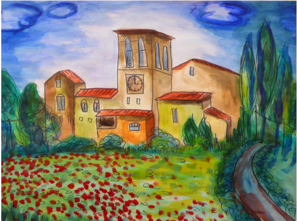
Julia - 18 Jahre Gehört in der Toscana Kunstschule - Farbton - Freie Waldorfschule Dresden - Deutschland