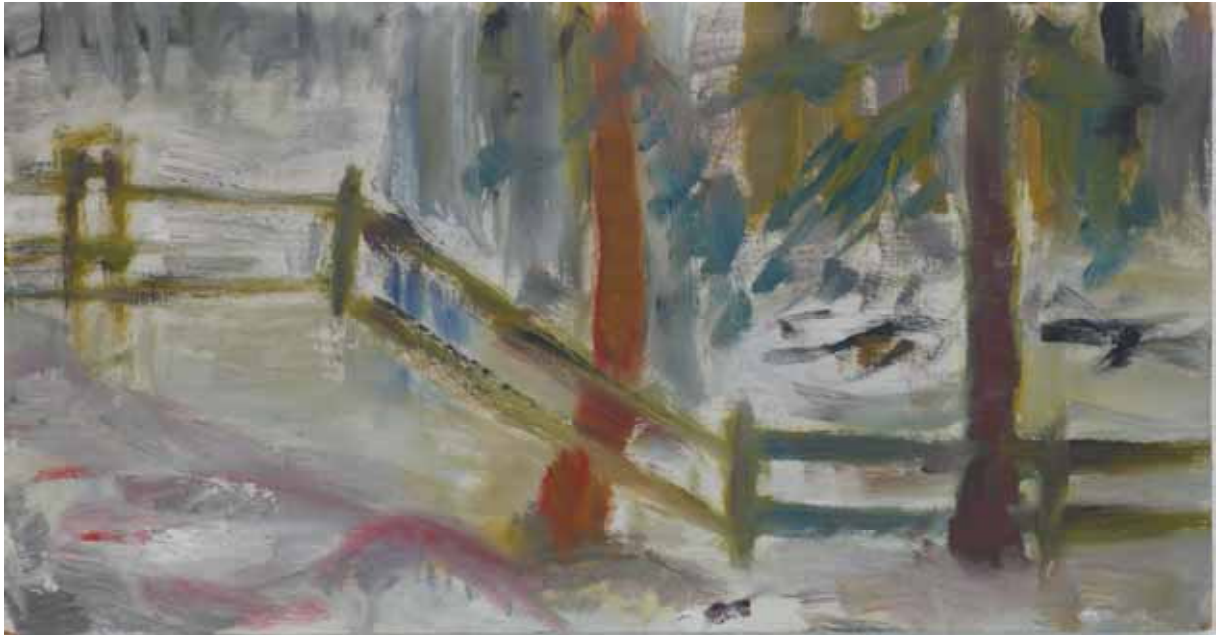
Gemälde in Öl Siehe Teilnehmerliste Kunstschule - Hyvinkää - Finnland