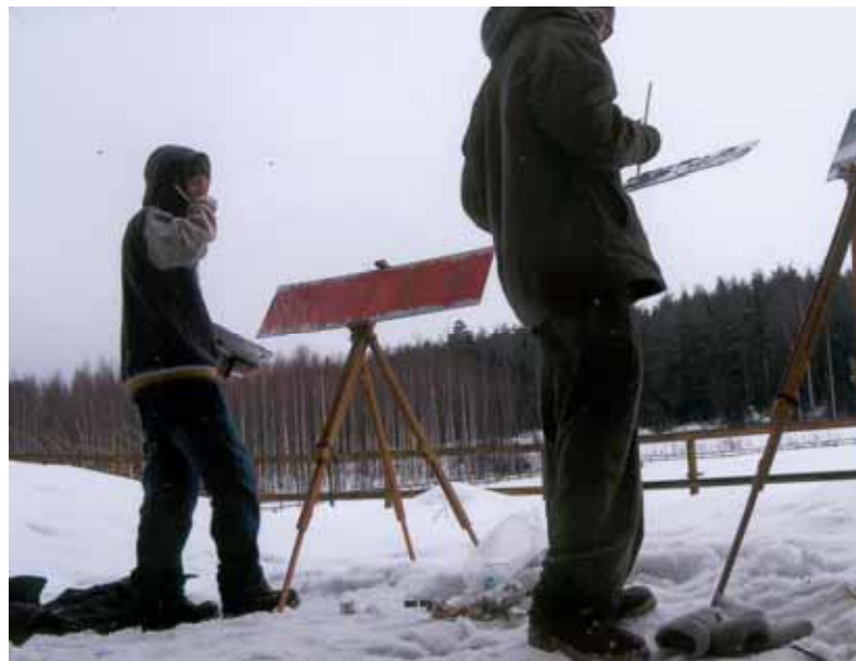
Foto Siehe Teilnehmerliste Kunstschulen - Hyvinkää - Finland