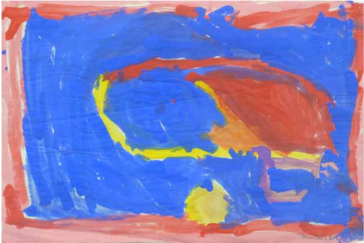
Amanthas Pro - 4 Jahre ohne Titel 29 x 44,5 cm

Sapumal Foundation -Museumspädagogik - Colombo Sri Lanka