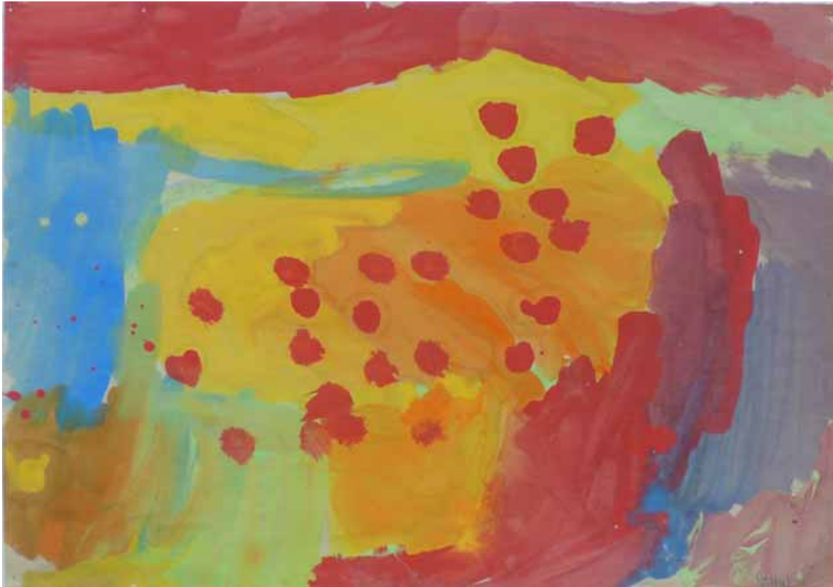
Rahul - 5 Jahre kein Titel 28,5 x 44,5 cm

Sapumal Foundation -Museumspädagogik - Colombo Sri Lanka