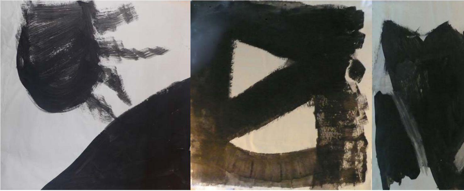
Schwarzer Zyklus 2-6 2007 Dispersion auf Papier